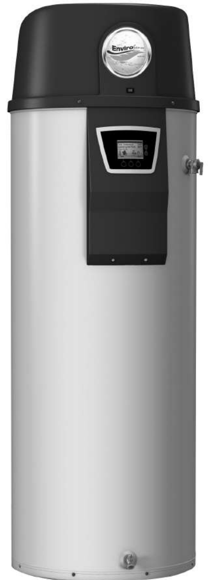
Modèle de 50 USG illustré